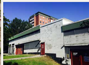
2 Parkeringsgaraget vid Larsbergsvägens slut upplevs som en otrygg plats.