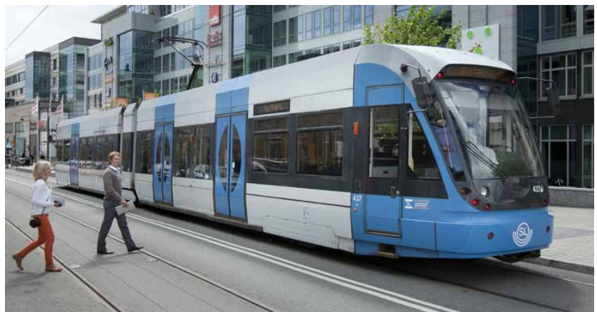
De nya, bekväma tågen är av samma typ som tvärbanans.

Att Lidingöbanan byggs om har knappast undgått någon Lidingöbo. Men vad blir egentligen den stora skillnaden?