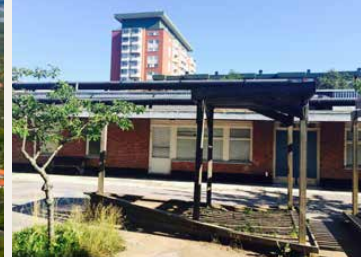
1 Förskolan invid centrum har stått tom länge.