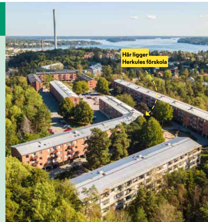
Här ligger Herkules förskola

Under 2018 förvärvade John Mattson 481 lägenheter på Mercuriusvägen och Herkulesvägen i Käppala. Fastigheterna, som uppfördes under perioden 1956–61, ligger i ett trivsamt område nära natur och vatten. Två av husen renoverades för några år sedan och enligt planerna kommer även resterande byggnader att rustas upp framöver.