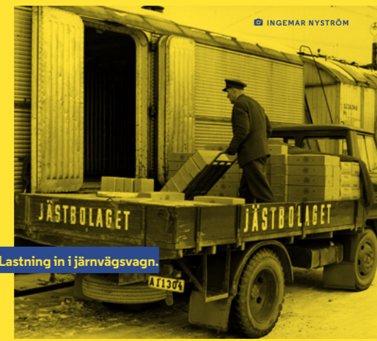
Lastning in i järnvägsvagn.

I TAKT MED att bagerierna blivit större med en närmast industriell drift har distributionen förändrats. Till de största kunderna levereras numera färdig jästlösning i tankbil. På så sätt blir det mindre spill och man slipper problemet med förpackningar. I livsmedelsbutikerna hittar du Jästbolagets produkter i Kronjässts karakteristiska gula förpackningar. □