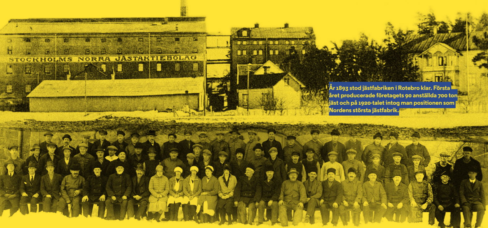
År 1893 stod jästfabriken i Rotebro klar. Första året producerade företaget 90 anställda 700 ton jäst och på 1920-talet intog man positionen som Nordens största jästfabrik.

VISSTE DU ATT en av våra mest populära fritidssysselsättningar är bakning? Faktum är att drygt ett par miljoner svenskar anger bakning som sin hobby. Förutom det smakfulla slutresultatet är det en både rolig och kreativ sysselsättning. Många aktiva hemmabagare hävdar dessutom att de blir lyckliga när de bakar.