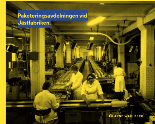
Paketeringsavdelningen vid Jästfabriken.